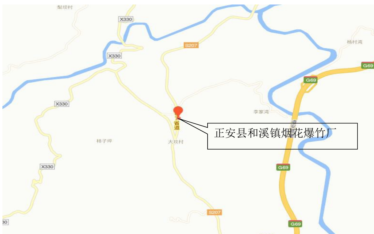
图 2.2-1 厂区地理位置图

正安县和溪镇烟花爆竹厂位于贵州省遵义市正安县和溪镇大坎村雄井湾，距正安县约 11 公里，距遵义市约 145 公里，交通便利。地址位置图见图 2.2-1。